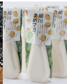
2012大賞 柳川まめマヨ