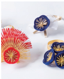
2016大賞 博多水引ポトルリボン

〒812-8577 福岡市博多区東公園7-7[事務局:福岡県 商工部 新事業支援課] Tel 092-643-3591 / Fax 092-643-3226 / E-mail design-2@fida.jp