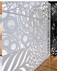
2013大賞 Archi skin