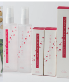
2011大賞 ヘアケアビューアローション 「椿なの」、「椿なのリペア」