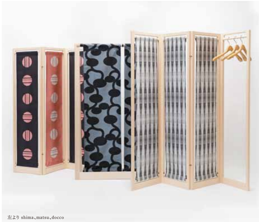
左より shima, matsu, docco

これまでも受賞作を出してきた意欲的な取り組みを行っている博多テックスLLP。今年度はテキスタイル・パターンにおいても「shima」「docco」「matsu」という3つの新しい方向性を打ち出し、従来からの伝統性とモダンの融合という姿勢を貫いている。木工メーカーとのコラボレーションであるパーテーションのフレームは、ハイタイプでは、上端にハンガーにも使えるR加工を施した2段バーを付加し、ファブリックのセッティングと兼用するなど、きめ細やかな配慮がうかがわれ好感が持てる。ロータイプの場合はスペーシングの検討を深めると汎用性が広がると思われる。色彩や文様の使い方にも可能性の広がりを感じさせる作品である。(講評/藤田雅俊)